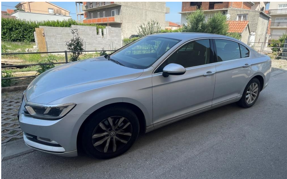
Slike 1. do 12.: Prikaz općeg stanja automobila